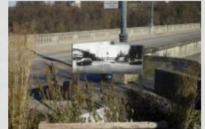
Animations Notre Dame