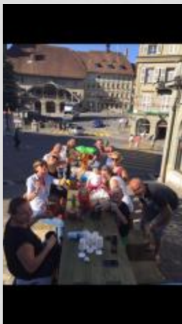
Table du Bourg